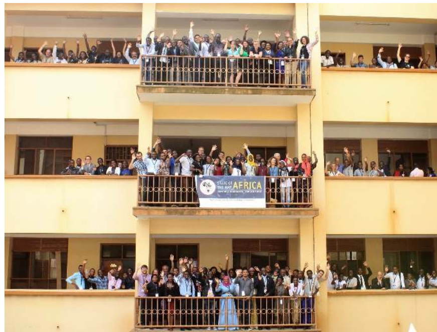
SOTM Africa, Kampala, Ouganda - juillet, 2017

Le programme de bourses SOTM Africa est géré par le comité des bourses du SOTM Afrique qui collabore avec les comités du budget et de la collecte de fonds pour recueillir des fonds pour les bourses. Les bourses accordées sont destinées à couvrir les frais de voyage, d'inscription à la conférence et d'hébergement des récipiendaires sélectionnés.