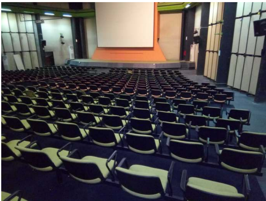
Salle à VITIB