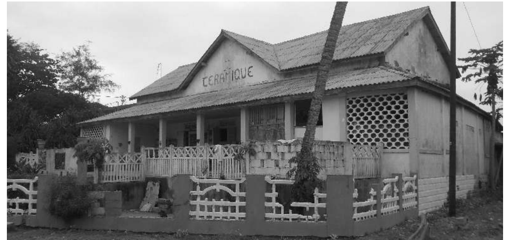
Centre céramique de Grand-Bassam

Première capitale de la Côte d'Ivoire, la ville est aujourd'hui classée au patrimoine mondial de l'Unesco. Son passé colonial et sa vieille ville donnant sur l'Océan Atlantique lui donnent un charme particulier. En tant que station balnéaire, Grand-Bassam dispose de nombreux atouts pour attirer les touristes ainsi que les rencontres internationales.